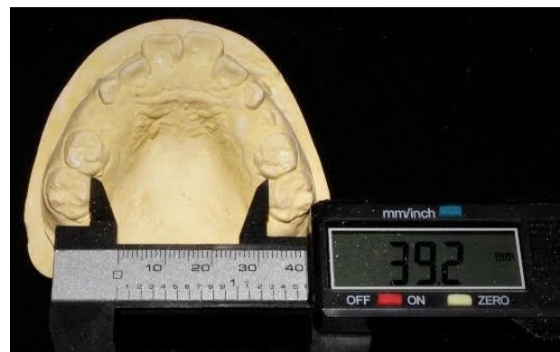
Figura 1: Medida del ancho intermolar.

Para la medición del ancho intermolar se utilizó un calibrador digital modelo HER-411 marca STEREN® el cual se colocó en los puntos de referencia previamente expuestos y para conseguir la altura del paladar se colocó una barra paralela al nivel oclusal y con el calibrador digital se obtuvieron las mediciones correspondientes en los modelos de todos los grupos (Figura 1 y 2).