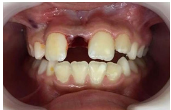
Figura 4. Imagen extra-oral inmediatamente después de la extracción.

Después de la cirugía, se prescribió paracetamol de 500 mg en caso de dolor.