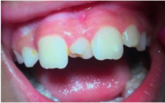
Figura 2. Visión Intraoral.

vestibular y oclusal del elemento 75 y en proximal del elemento 84. De este modo, se le instruyó la higiene oral al paciente y se le solicitó la toma de una radiografía panorámica (Figura 3) para la visualización de los elementos en formación, buscando una mejor planificación del caso. Con interés en publicar el trabajo, se le pidió al responsable del niño, la firma para el término de consentimiento de uso de imágenes, como se suele pedir antes de iniciar el tratamiento en la clínica.