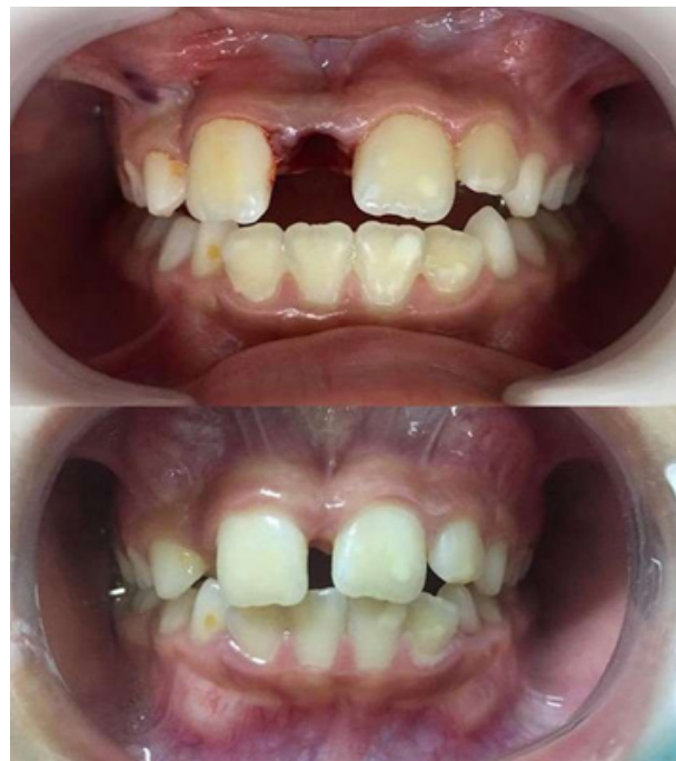
Figura 7. Comparación del momento postquirúrgico inmediato (diastema de 10 mm) y reevaluación del paciente a los 3 meses (diastema de apenas 3 mm).