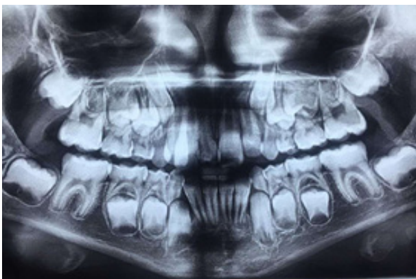
Figura 3. Radiografía panorámica con diente supernumerario.

En las siguientes consultas, se realizaron restauraciones masivas, con remoción de tejido cariado con fresa esférica laminada (de fisuras) y cucharita de dentina en los molares primarios 75 y 84, utilizando cemento de ionómero de vidrio (CIV)