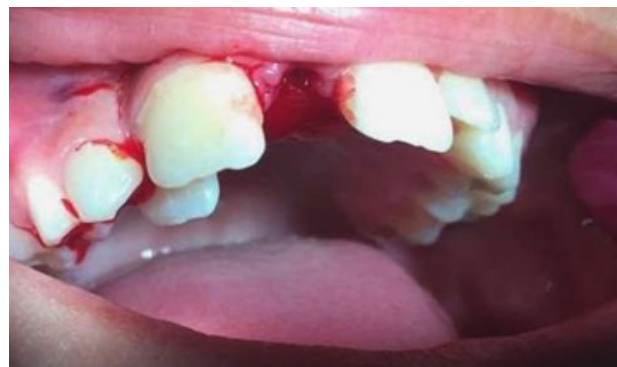
Figura 8. Imagen intra-oral post-extracción, donde se puede ver el elemento 12 desplazado palatinamente.