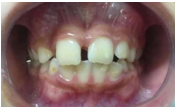
Figura 6. Reevaluación del paciente después de 3 meses con diastema visiblemente menor.

Debido a una pausa en el atendimento de la clínica integrada del niño y adolescente de la Unigranrio con el fin del semestre lectivo, el paciente fue citado para regresar después de 3 meses. A su regreso, se observó el diastema entre los dientes incisivos centrales superiores con un espacio significativamente menor (Figuras 6 y 7), lo que produjo un cambio en la apariencia y comportamiento del paciente, mostrándose un niño mucho más confiado y cómodo. A pesar de no ser el objeto de estudio del presente artículo, el paciente fue posteriormente referido para ortodoncia, como está indicado en el tratamiento de dientes supernumerarios y diastemas anteriores 23 a fin de complementar el tratamiento a través del uso de placa de Hawley con expansor maxilar, buscando la corrección del apiñamiento causado por la falta de espacio en la arcada superior para el posicionamiento del elemento 12 (Figura 8), que se encontraba desplazado palatinamente.